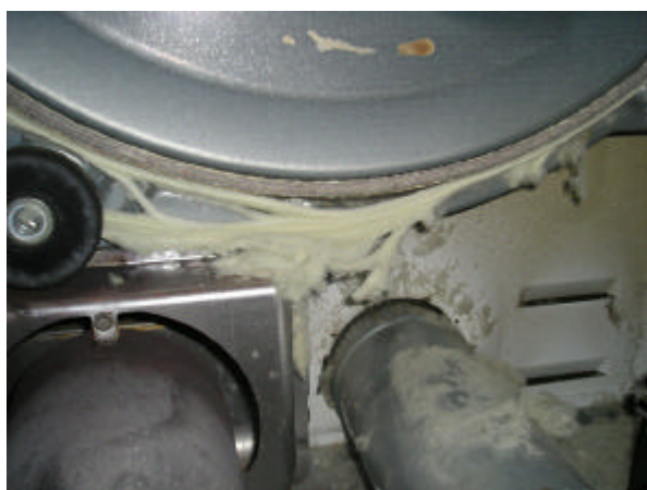
〔 機器内部のほこり堆積状況 〕